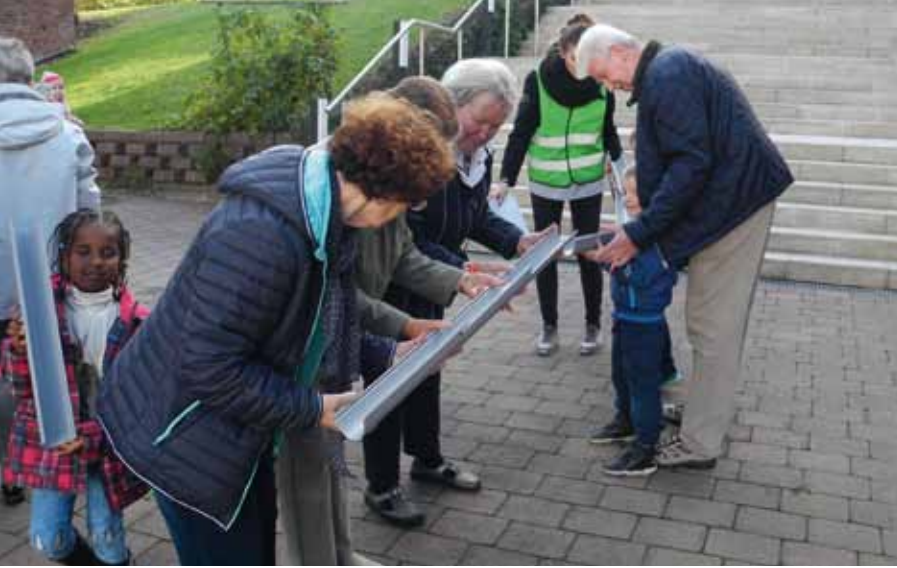
Bild: Caritas-Jahreskampagne 2016: „Mach Dich stark für Generationengerechtigkeit“